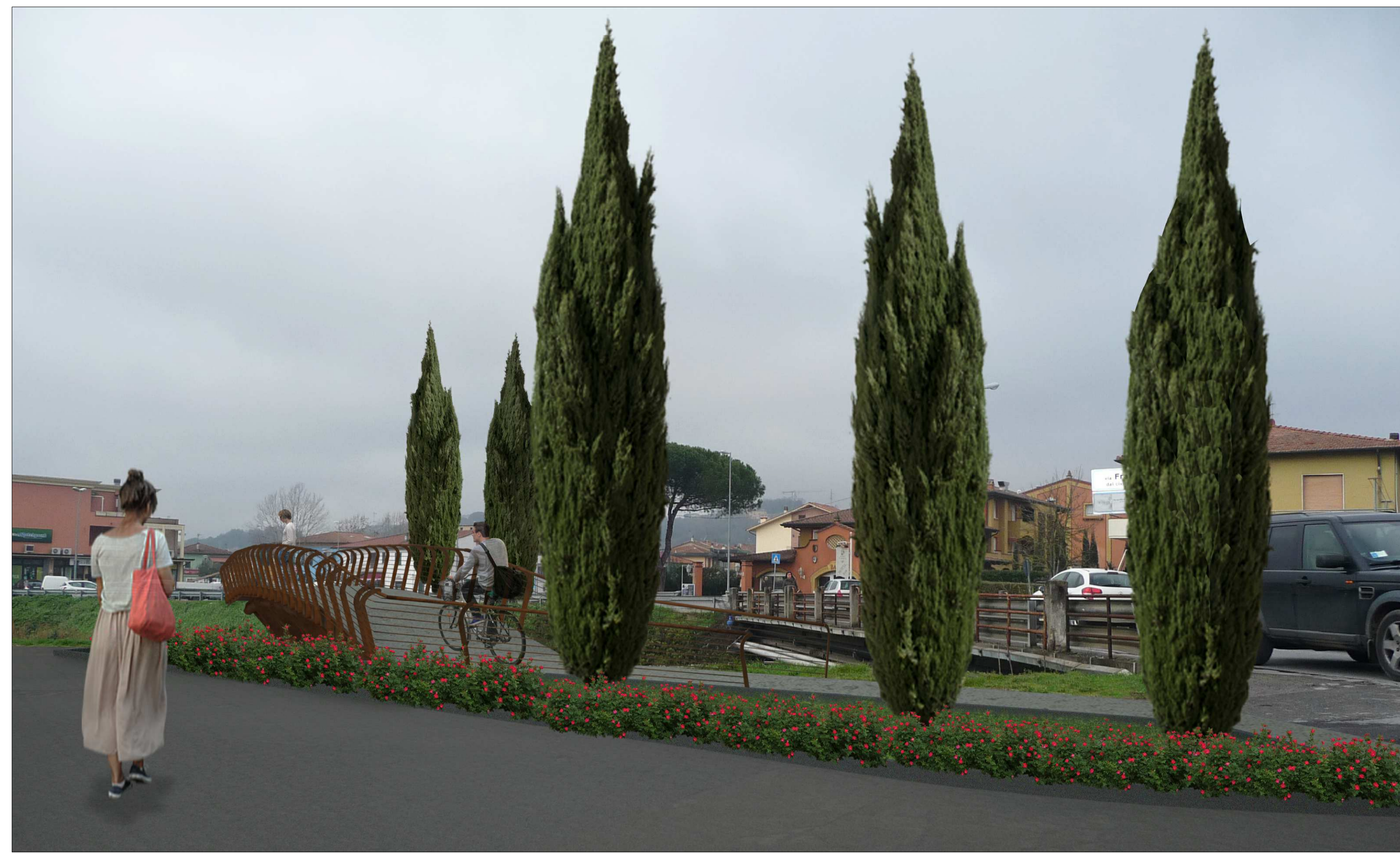
Fotoinserimento della nuova passerella vista dalla Via Vecchia di San Donato

Fotoinserimento della nuova passerella ciclopedonale