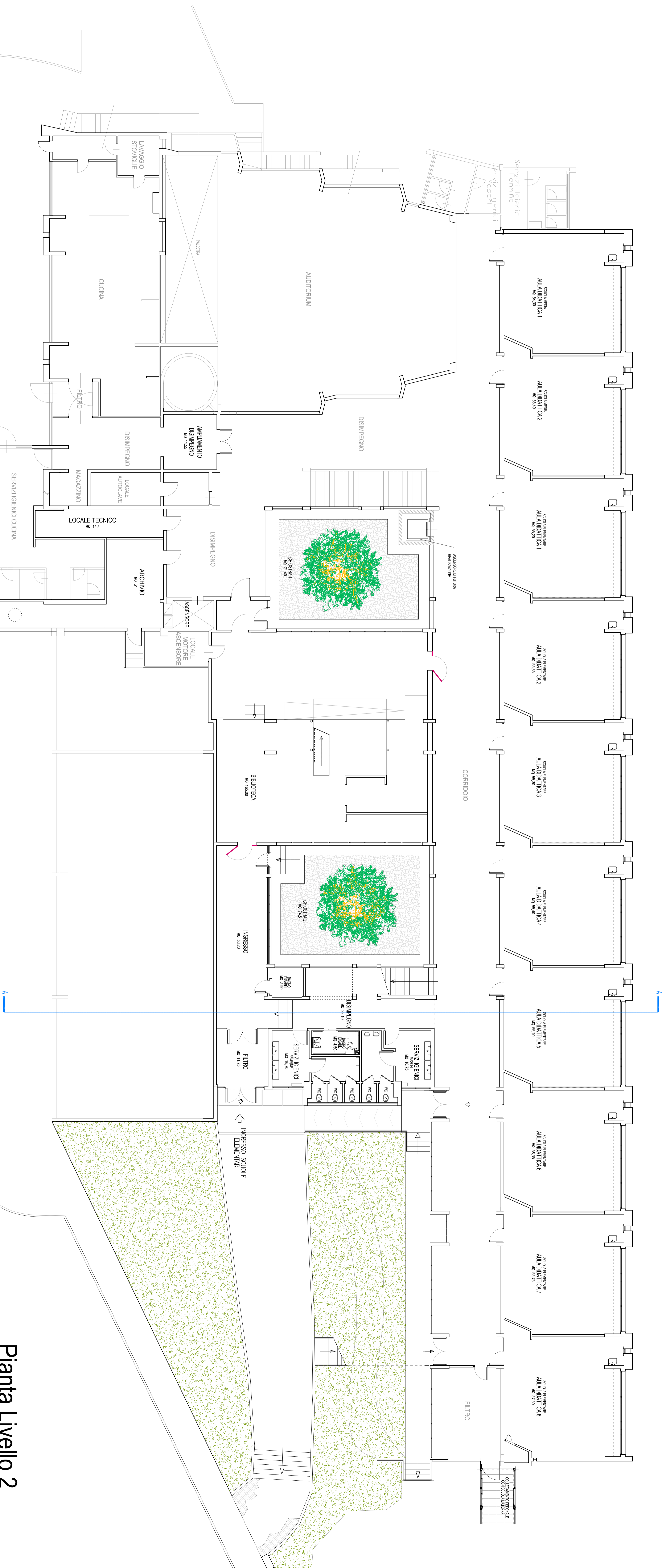
Pianta Livello 2 + 8.30 m