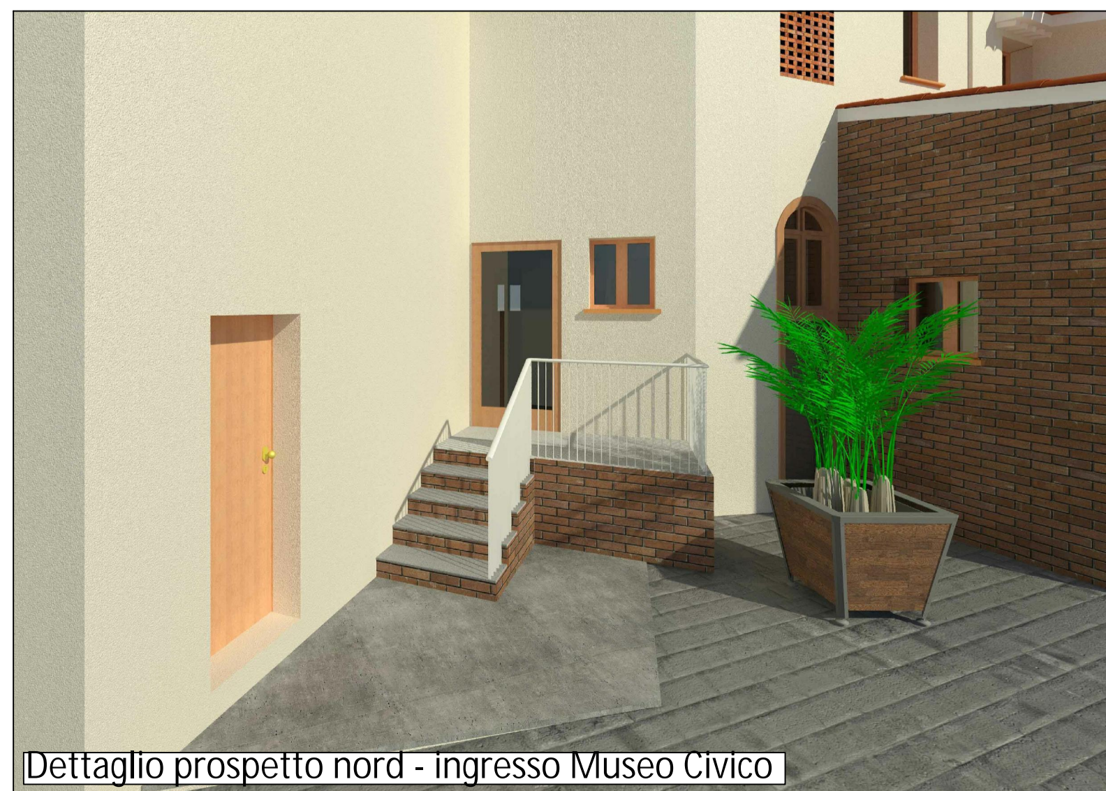
Dettaglio prospetto nord - ingresso Museo Civico