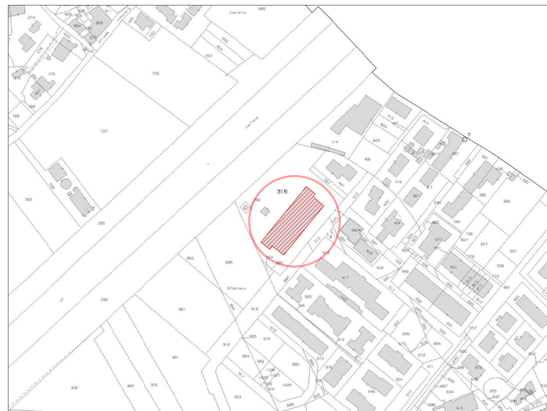
ESTRATTO CATASTALE - Fg. 30, P.lla 316