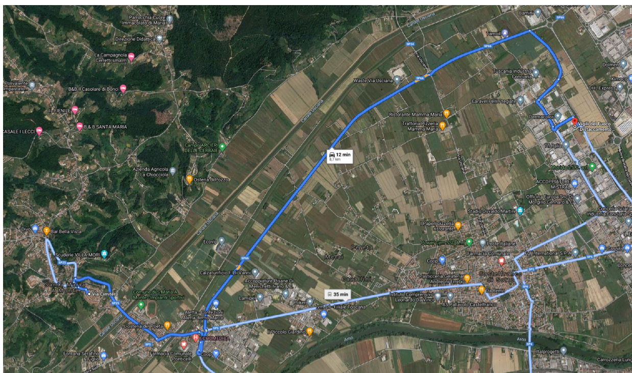
FIGURA 1: Percorso più rapido all'area oggetto di intervento, da comando operativo VVF di Castel Franco di Sotto.

L'immobile è posto in adiacenza ad altri edifici, generalmente adibiti a civile abitazione e presenta pareti libere su 2 lati. Il fronte principale è sulla Via Cimitero, il fronte opposto è affacciato verso gli spazi esterni del complesso della rocca e permette l'accesso o l'esodo pedonale verso gli stessi (luogo sicuro).