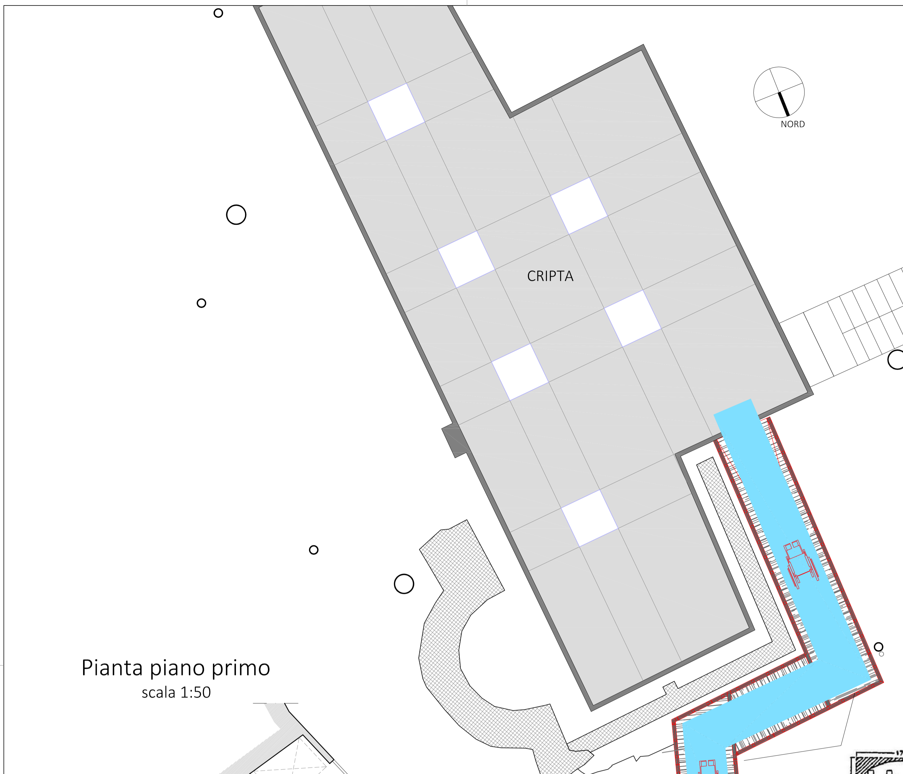
Pianta piano primo scala 1:50