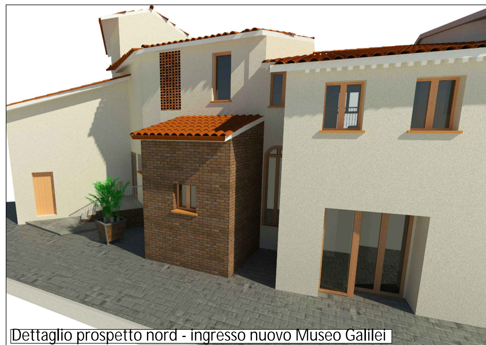
Dettaglio prospetto nord - ingresso nuovo Museo Galilei