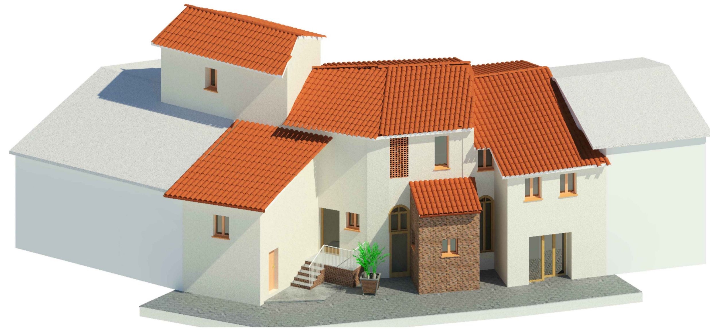
Vista prospetto nord - lato strada