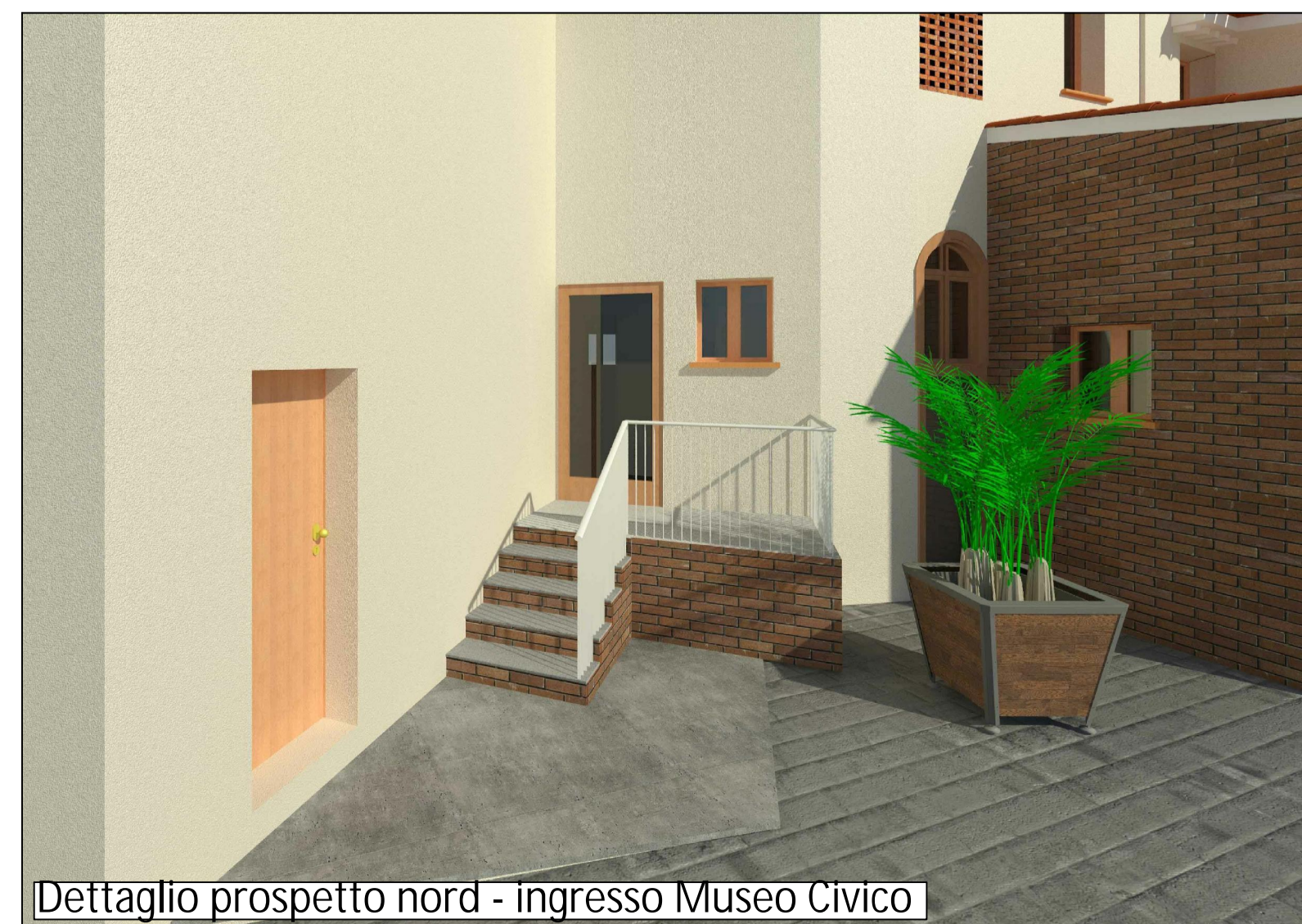
Dettaglio prospetto nord - ingresso Museo Civico