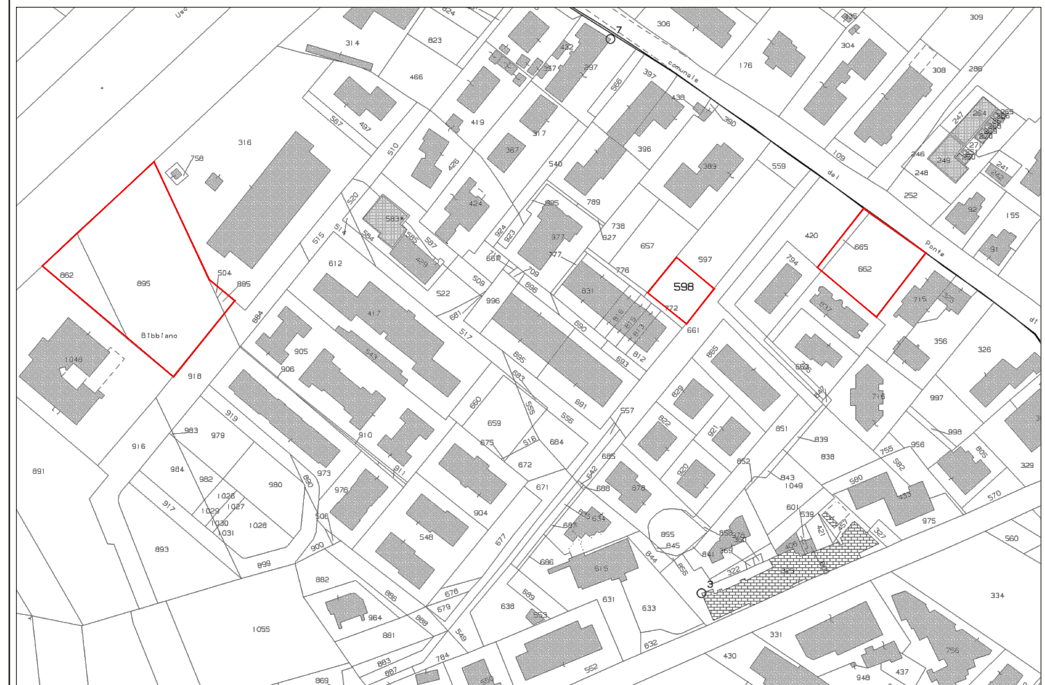
Estratto di Mappa Catastale Foglio 40 non in scala